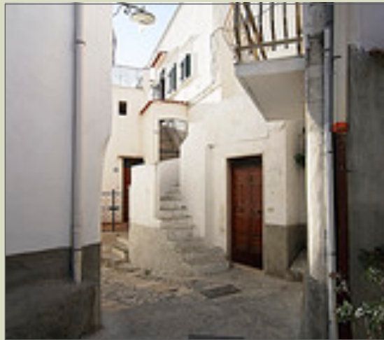
Il centro storico

Chi giunge a Peschici deve "obbligatoriamente" entrare nel centro storico da "porta del monte". Da qui si snodano, come "origami" di una "casbah" orientale, le stradine del borgo antico tutte contenute in mura fortificate, intervallate da torrette di. Nel borgo medioevale sono concentrati i 1000 negozietti artigianali che offrono dalle ceramiche artigianali, ai souvenir, ai dolci, ai gelati, all'olio d'oliva e tanto altro ancora..